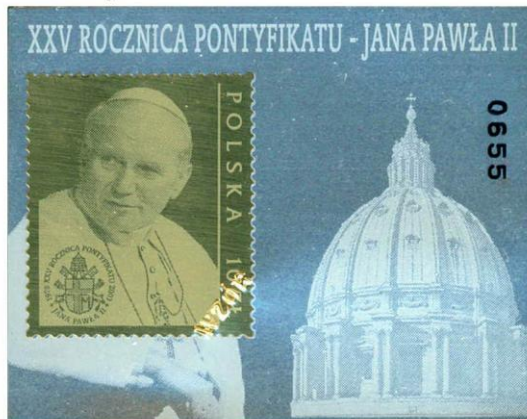
Il. 2. Srebrna plakietka: