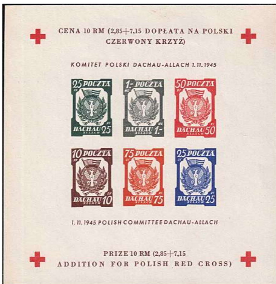
il. 2 Blok nr 5 Aa bez znaku wodnego. Bloki te zasadniczo posiadają różne znaki wodne opisane w literaturze [2] i [3]. Blok nr 5Aa bez znaku wodnego występuje bardzo rzadko.