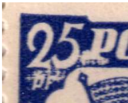
il. 1 Zn. nr 1 by z usterką druku. Na zn. z 12 pola w arkuszu, widoczny jest brak farby (biała plama) w górnym lewym rogu przy nominale 25 PF i literze P (Poczta). Ta usterka druku występuje na większości arkuszy znaczków 1 by.

Poniżej załączam sześć przykładów niekatalogowanych walorów, gdzie numeracja bloków jest oparta na podstawie mojego artykułu [3].