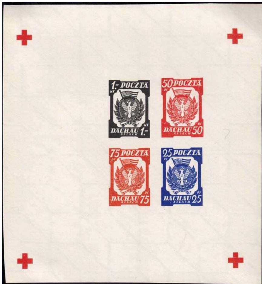
il. 3 Blok nr 5 AaP - próba fazowa. Widoczny jest brak napisów i dwóch znaczków pierwszej kolumny. Jest to bardzo rzadko spotykana próba tego wydania.