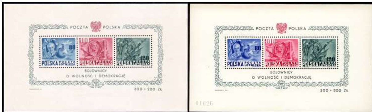
il. 1 Blok nr 11 "Bojownicy o wolność i demokrację" bez i z kolejnym numerem.

Jest jeszcze wiele nieznanych faktów dotyczących polskich znaczków produkowanych w Szwajcarii dla Poczty Polskiej, stąd i wiele krążących wokół nich mitów nie popartych żadnymi wiarygodnymi dokumentami. W tym artykule pragnę jeśli nie obalić, to naruszyć jeden z nich, dotyczący bloku 11 bez kolejnego numeru, a utrwalany przez ekspertów w wystawianych atestach.