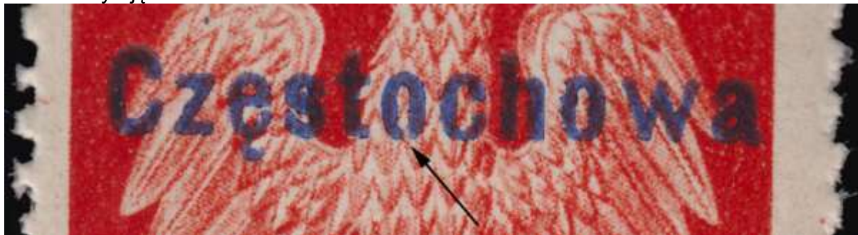
il. 3 usterka w pierwszym „o” w Częstochowa

Znaczna część usterek została ujęta i opisana w PSPZP i katalogu Fischera, ale zdarzają się również powtarzalne usterki formy przedrukowej, które w tych publikacjach nie zostały ujęte.