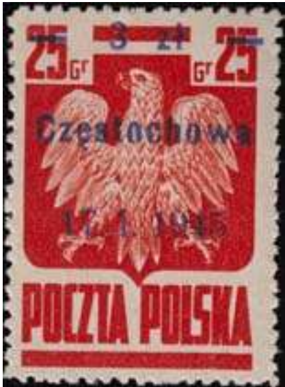
il. 1 zn PSPZP 299/Fi.349 z usterką

Znaczki z serii okolicznościowej poświęconej upamiętnieniu wyzwolenia Ziemi Polskiej spod okupacji niemieckiej (popularnie nazywanej „Wyzwolenie 10 miast”) zostały wprowadzone do obiegu z dniem 12.02.1945 r. (zarządzenie Ministra PiT z dnia 12.02.1945) i wycofane z obiegu 31.05.1945 r. (zarządzenie Ministra PiT z dnia 20.04.1945).