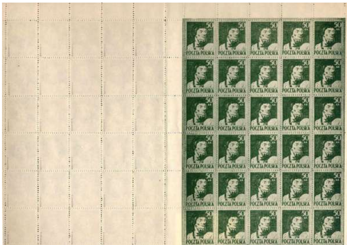
sektor 1 (A ?)

patrzac na obraz od strony sektora B (2) - prawidlowy (A, B) patrzac na obraz od strony sektora A (1) – calkowicie odmienny od opisanego i trudny do określenia sposobu wykonania perforacji, gdyż otwory, których obrzeż powinny być wklęsłe (skierowane „w dół”) są wypukłe (skierowane „w górę”).