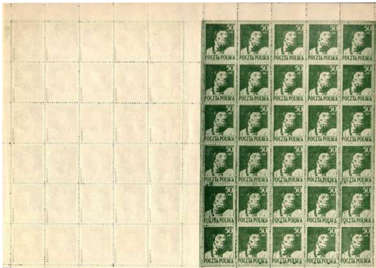
sektor 2 (B)