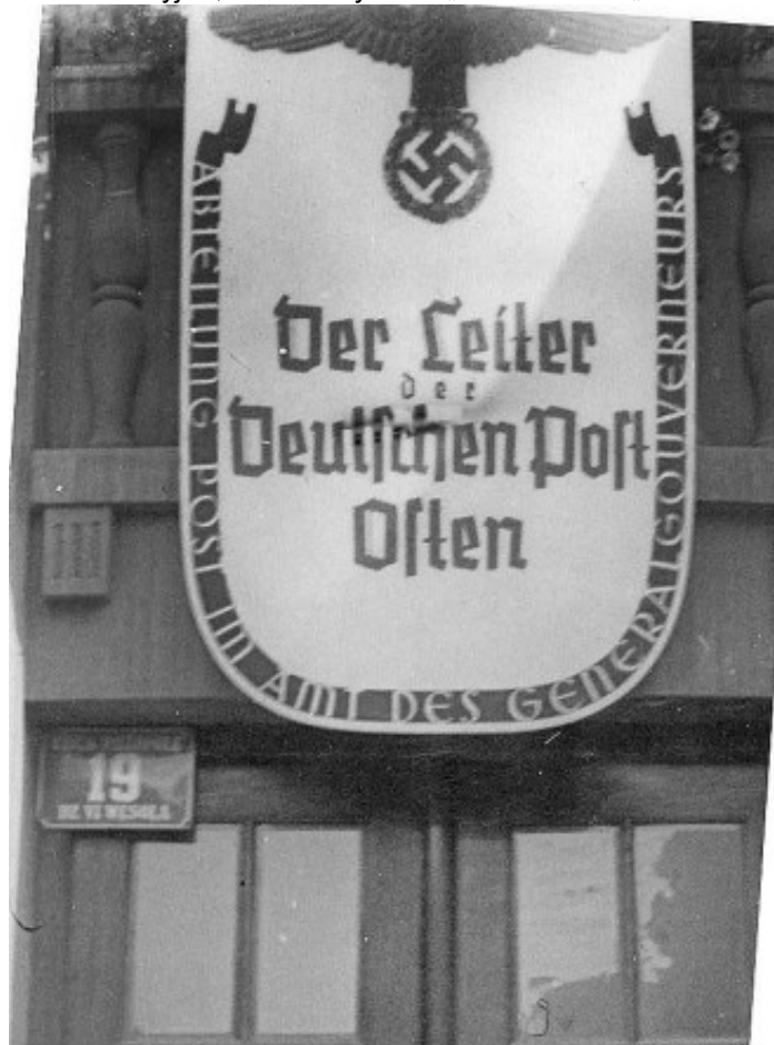
il. 1. Wejście do gmachu DPO.

Skrót DZ VI, to nazwa dzielnicy Wesoła. Przed II wojną światową Kraków był podzielony na 22. jednostki administracyjne, które nazywano „działami” lub „dzielnicami katastralnymi”.