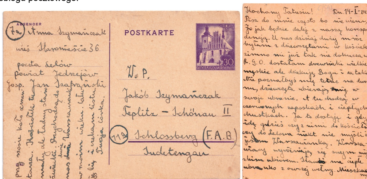
il. 2. Kartka wysłana 14.01.1945 r. ze wsi Staromieście (poczta Lelów) do Teplitz-Schönau (Cieplice).

Kartka GG Fi. nr Cp 8II o nominale 30 gr (zgodnie z taryfą mogła mieć nominalną wartość 12 gr) nie została skasowana żadnym datownikiem, co uniemożliwia stwierdzenie, czy pochodzi z autentycznego obiegu pocztowego.