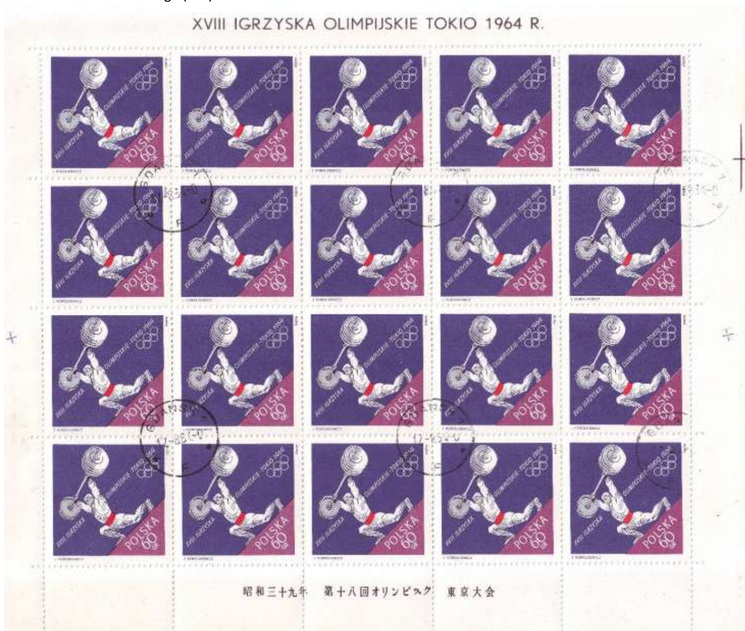
il. 5 arkusz sprzedażny - drugi sektor.

W trakcie badań zgromadziłem znaczki z dodatkową kropką środkową na luźnych znaczkach czystych i z obiegu. Występuje ona także na niektórych znaczkach 1336 (Fi. 1368) wykorzystanych do FDC. Na jednym z portali aukcyjnych nabyłem arkusz znaczka z dodatkową kropką środkową. Usterka występuje na polu 15. arkusza sprzedażnego z drugiego sektora arkusza drukowego (il. 5).