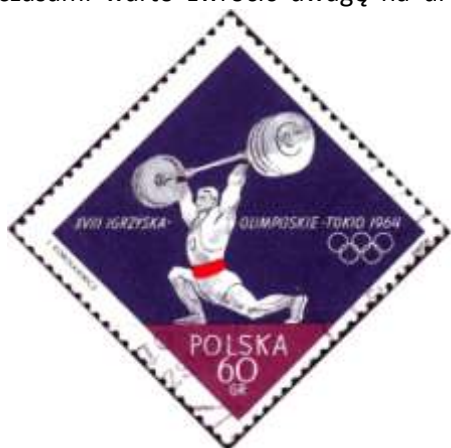
il. 1 znaczek 1336 (Fi. 1368) z obiegu pocztowego.

Zbieranie znaczków to prywatna domena kolekcjonerów i każdy indywidualnie wybiera obszar swojej pasji. Ale czasami warto zwrócić uwagę na uroki zbieractwa „starych” polskich walorów pocztowych. Oczywiście twierdzenie „starych” dla większości Filatelistów kojarzy się z prawdziwymi Filatelistycznymi klasykami. Ale przecież emisje z lat 60-tych to wręcz klasyki przy walorach, którymi rączy nas obecnie Poczta Polska. To także wspaniały materiał do badań Filatelistycznych. Tak było tym razem w moim przypadku. Przeglądając pojedyncze znaczki z obiegu z lat 60-tych zwróciłem uwagę na znaczek 1336 (Fi. 1368) z nietypową kropką (il. 1). Kropka środkowa występuje nie tylko przed wyrazem TOKIO ale także po wyrazie IGRZYSKA (il. 2). Zaciekało mnie jednocześnie, dlaczego na znaczkach tej serii przedstawiono właśnie takie konkurencje sportowe? Przecież rywalizacja na XVIII Igrzyskach Olimpijskich w Tokio odbywała się w 163 konkurencjach w 19 dyscyplinach 1 . Odpowiedzi na to pytanie możemy odszukać w dokumentach zgromadzonych w Muzeum Poczty i Telekomunikacji we Wrocławiu.