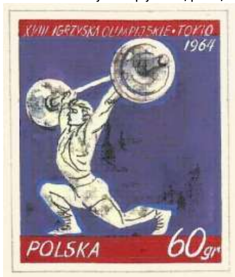
il. 3 projekt znaczka 1336 (Fi. 1368)

Ciekawostką jest odręczna notatka z dnia 27 lipca 1963 r. znajdująca się na ww. piśmie dotycząca uzgodnień z PKOl możliwych dyscyplin na bloczku: Kajaki, Szermierka, Strzelectwo, Judo lub Koszykówka. Jak wiemy wybrano koszykówkę.