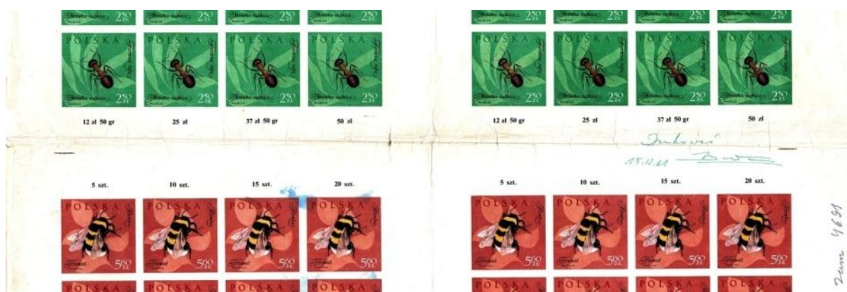
il. 1 Istotny fragment akceptu zn. 1107 i 1108 pokazujący układ sektorów na formie

Zdawało by się zapytać, co w tym dziwnego? Jest jednak co wyjaśniać. Otóż arkusz drukowy obejmował dwa sektory zn. 1107 i dwa sektory zn. 1108 (il. 1). Jeśli weźmie się pod uwagę ich sposób drukowania oraz fakt, że nakład zn. 1108 wynosi 500.000 szt. powstaje pytanie, skąd taka różnica? Tutaj chcę przypomnieć, że w taki sam sposób wydrukowano zn. 1184-89, a w zn. 1017-28 drukowano w każdym z czterech sektorów inny znaczek i tam takich różnic nie ma.