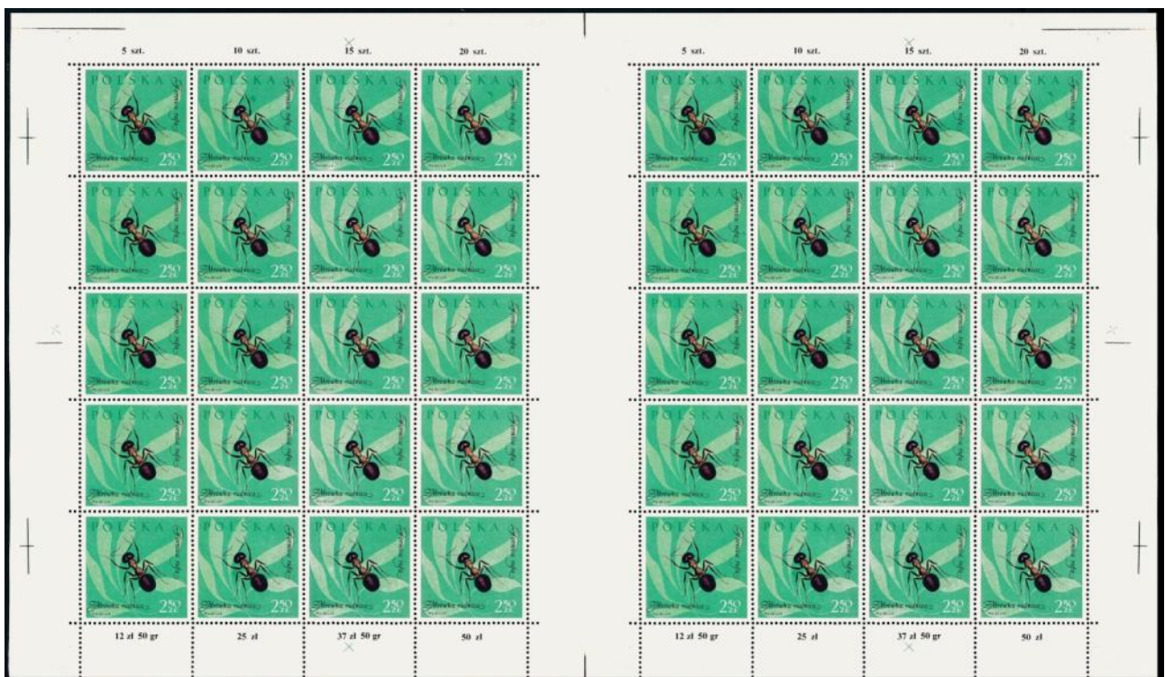
il. 3 forma III „mrówki” drukowana z formy dwusektorowej (rekonstrukcja komputerowa).