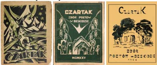
il. 3: z 1922