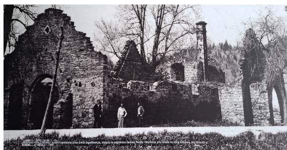
il. 5 ruiny „Czartaka” zdj. z lat 30-tych XX w.