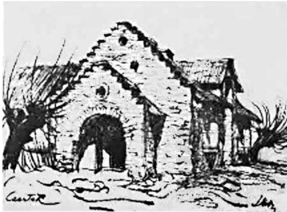
il. 6 „Czartak” – litografia z 1928.

Dodam, że austeria to dawne określenie karczmy, zajazdu lub oberży, często położonej przy drodze, oferującej nocleg i wyżywienie. Słowo to pochodzi z języka włoskiego ( osteria ) i oznaczało miejsce gościnne, często prowadzone przez społeczność żydowską, szczególnie w dawnej Galicji. W tle wyimaginowane przez projektanta wysokie góry. Dziś po ruinach nie ma śladu, są bowiem na dnie sztucznego jeziora Mucharskiego (il. 7).