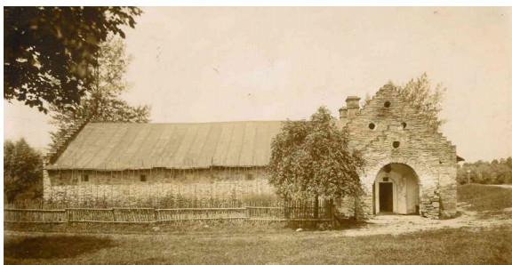
il. 4 austeria „Czartak” w Mucharzu z przed 1890.

Dругim elementem ukazany na znaczku są ruiny budynku starej austerii „Czartak”. Ilustrację ruin budynku projektant przedstawił na podstawie własnej wiedzy i autolitografii „Czartak” (1928) autorstwa – pochodzącego ze spolonizowanej rodziny węgierskiej – Ludwika Misky, członka grupy. To właśnie od jej nazwy wzięła się nazwa grupy (il. 4-6).