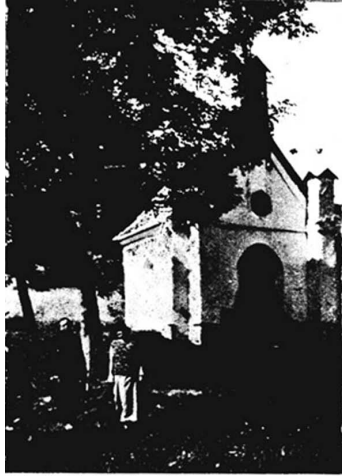
Fot. X. St. Matyka 1924